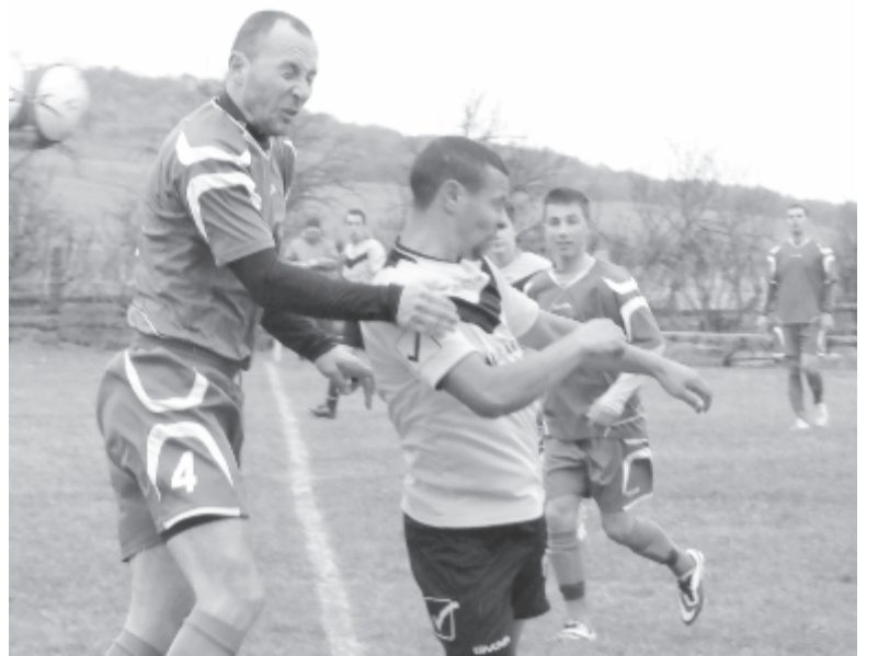
A hazaiak egy fejjel magasabban játszottak, s a szerencse is hozzájuk pártolt.